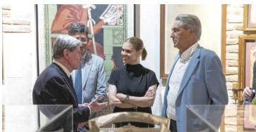
La alcaldesa anunció la colocación de un hito dedicado a los Condueños en la Plaza de Cervantes "para que perdure la memoria de su hazaña cívica entre los alcalaínos y visitantes"