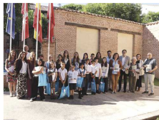
Entrega de Premios de la XLI edición del Certamen Literario Infantil y Juvenil Cervantes